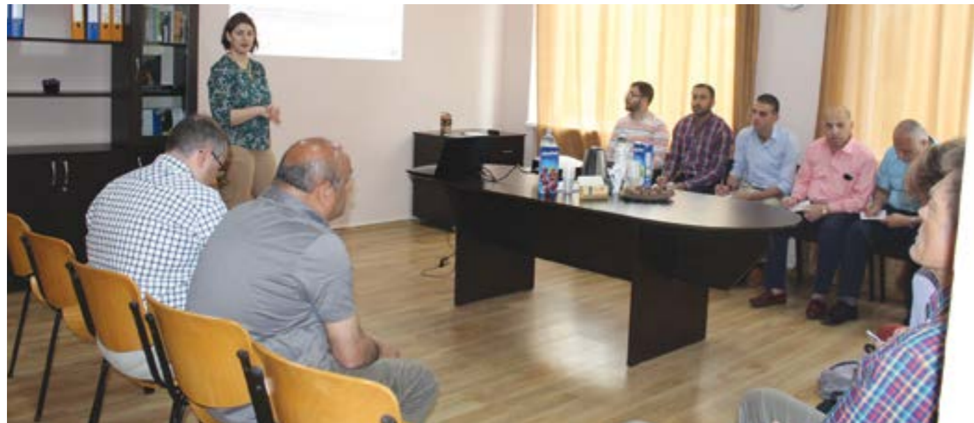
8 მაისს საქართველოს ზრდასრულთა განათლების ქსელს (GAEN) გერმანიის სახალხო უნივერსიტეტთა ასოციაციის საერთაშორისო თანამშრომლობის ინსტიტუტის (DVV International) ოფისების წარმომადგენლები ესტუმრნენ იორდანიიდან, ბელორუსიიდან, სომხეთიდან, უკრაინიდან, მოლდოვიდან.

რისო თანამშრომლობის ინსტიტუტის (DVV International) ოფისების წარმომადგენლები ესტუმრნენ იორდანიიდან, ბელორუსიიდან, სომხეთიდან, უკრაინიდან, მოლდოვიდან.